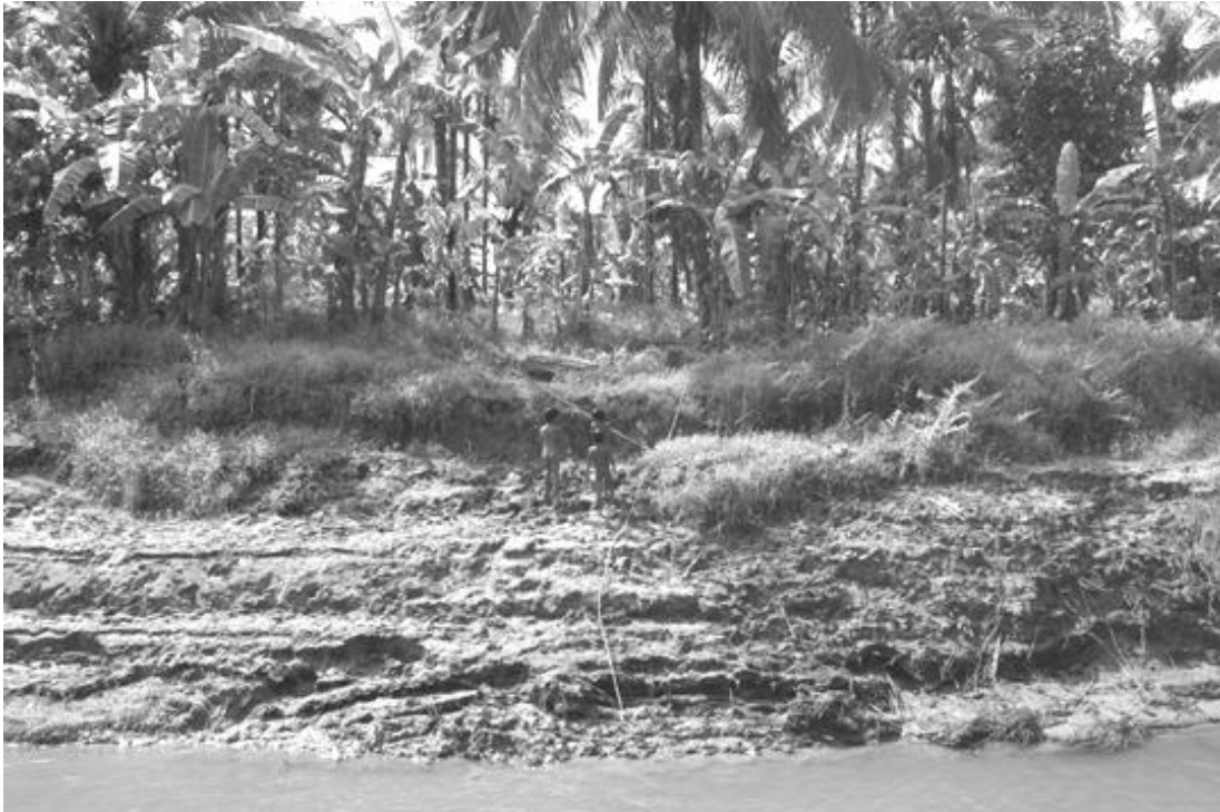
Kinderen op Siberut jungle spelen bij de rivier en in de jungle. De vraag is, hoe lang nog?

De dorpingen weten niet tot wie zij zich moeten wenden om dit probleem opgelost te krijgen. De Bupati (burgemeester) die honderden kilometer verder woont en kantoor houdt op het eiland Sipora, is nooit naar Muara Siberut gekomen om over dit probleem te praten. Men heeft mij verteld dat daar wel op is aangedrongen, maar ondanks beloften is hij nooit komen opdagen.