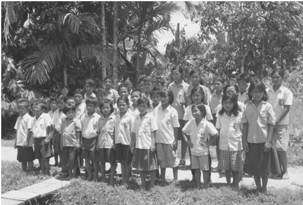
Een deel van de 69 schoolkinderen op Siberut die door Howu-Howu worden gesteund.

Momenteel gaat Howu-Howu door met steun aan 346 kinderen naast de kinderen in het dorp van Herman in Slappak .Ze worden gesteund vanaf het eerste jaar op de basisschool tot en met het laatste jaar van de middelbare school. Het zijn vooral meisjes: 60 %! Wij steunen juist de meisjes om de ouders te stimuleren ook meisjes te laten leren. Ouders sturen eerder de jongens naar school om verzekerd te zijn van hun steun als ze ouder worden. In de praktijk zorgen meisjes vaker dan jongens voor hun ouders. Er zijn nog honderden kinderen die ook graag steun van Howu-Howu zouden willen ontvangen, maar daarvoor zijn de middelen niet toereikend. Howu- Howu moet goed selecteren, want de stichting is afhankelijk van haar donateurs.