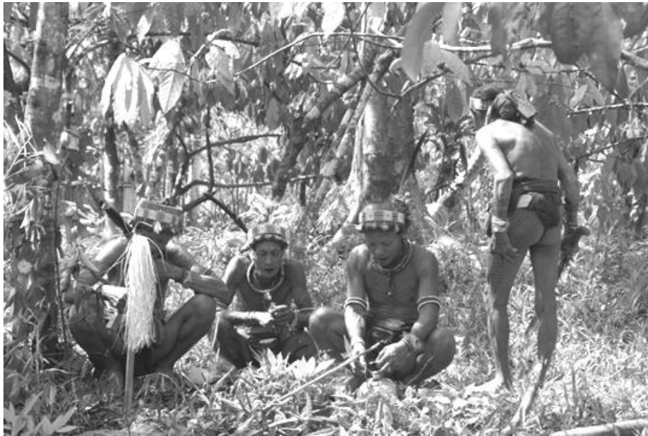
Medicijnmannen zijn aan het werk om medicijnen te verzamelen voor een zieke man.